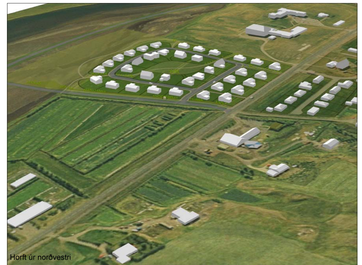
Horft úr norðvestri