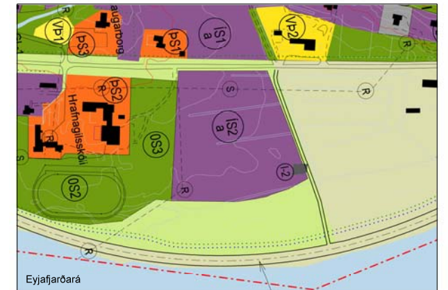
AÐALSKIPULAG EYJAFJARÐARSVEITAR 2005-2025 1:10.000