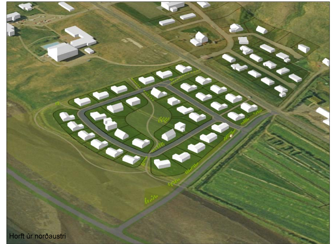
Horft úr norðaustri