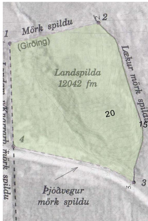
Mynd 1. Yfirlitsmynd – Afmörkun lands (Teiknistofan Storð ehf, 2022).

Skipulagssvæðið sem um ræður hefur ekki verið í ræktun og er það að hluta til vegan hæðarlegum og rýrs jarðvegs, en ofar í landinu og sunnan við landið eru ræktuð tún sem eru enn nýtt. Rýrir ekki ræktað land